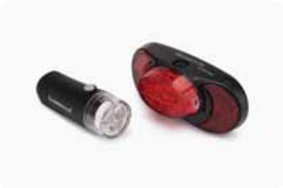
ILUMINAÇÃO A PILHAS