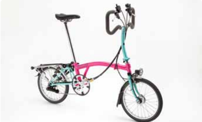
MODELO PRINCIPAL P6R/P6R-X O porta-bagagens para transporte de bagagem adicional e as 6 velocidades bem escalonadas acrescentam peso, mas a P6R foi concebida para viagens mais longas e não tanto para pequenos trajectos diários. Fornecida com guarda-lamas, porta-bagagens e iluminação com dínamo Shimano. 12,4kg / 11,5kg