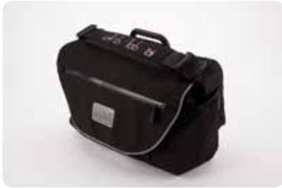
S BAG E ABA AMOVÍVEL