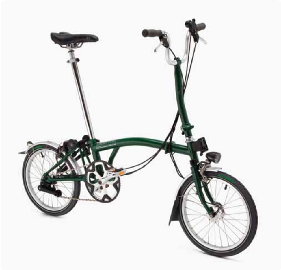
H2L VERDE INGLÊS