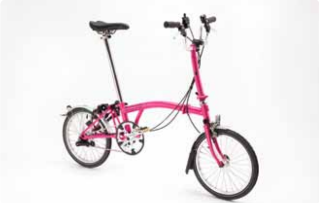
MODELO PRINCIPAL M3L/M3L-X A Brompton clássica, com o eixo BSR Sturmey Archer de 3 velocidades; a combinação versátil para todo-o-terreno da nossa gama. Fornecida com guarda-lamas e iluminação a pilhas. 11,5 kg / 10,5 kg