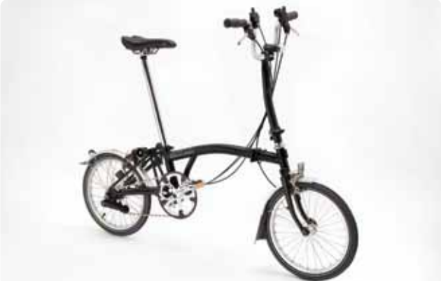
MODELO PRINCIPAL H6L/H6L-X Com 6 velocidades para viagens mais longas, a condução superior do Tipo H não o deixa perder a paisagem ao longo do percurso. Fornecida com guarda-lamas e iluminação a pilhas. 11,8kg / 10,8kg