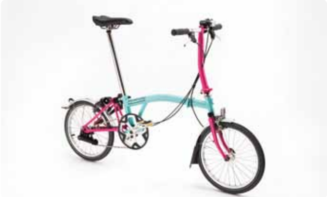
MODELO PRINCIPAL S2L/S2L-X A personalidade desportiva do Modelo S é complementada pelo ágil desviador de 2 velocidades; evitando as velocidades internas, conseguimos uma bicicleta leve, apropriada para a maioria das viagens. Fornecida com guarda-lamas e iluminação a pilhas. 10,7 kg / 9,8 kg