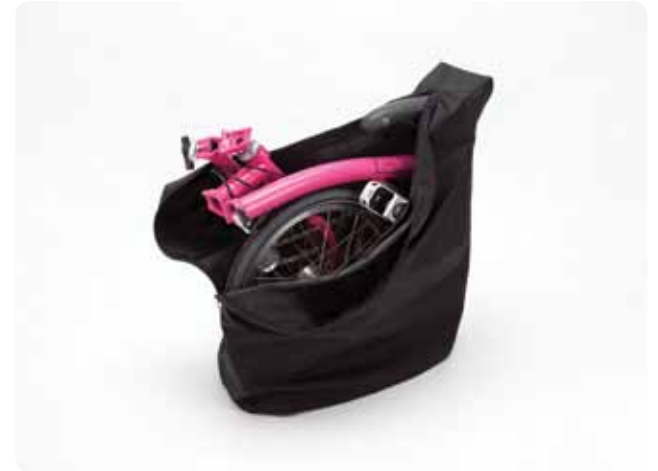
COBERTURA E SACO DE SELIM

Fabricada em nylon rígido com acolchoamento de 5 mm, protege a Brompton enquanto viaja. A base é reforçada, com rolamentos integrais. Possui bolsos adicionais, correia para ombro e pegas. Pode ser dobrada para melhor arrumação.