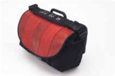
S BAG ABA EM MANGUEIRA